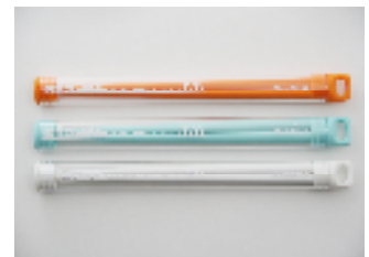
エコポケ・マイハシ

09 年度はグッズ販売が主だった仕事になりましたが、来年度は本格的に孤児院の工房と一緒に動いていこうと計画を立てています。